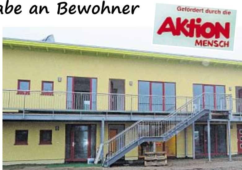
August-Seidel-Straße (Eingang - Hofseite)