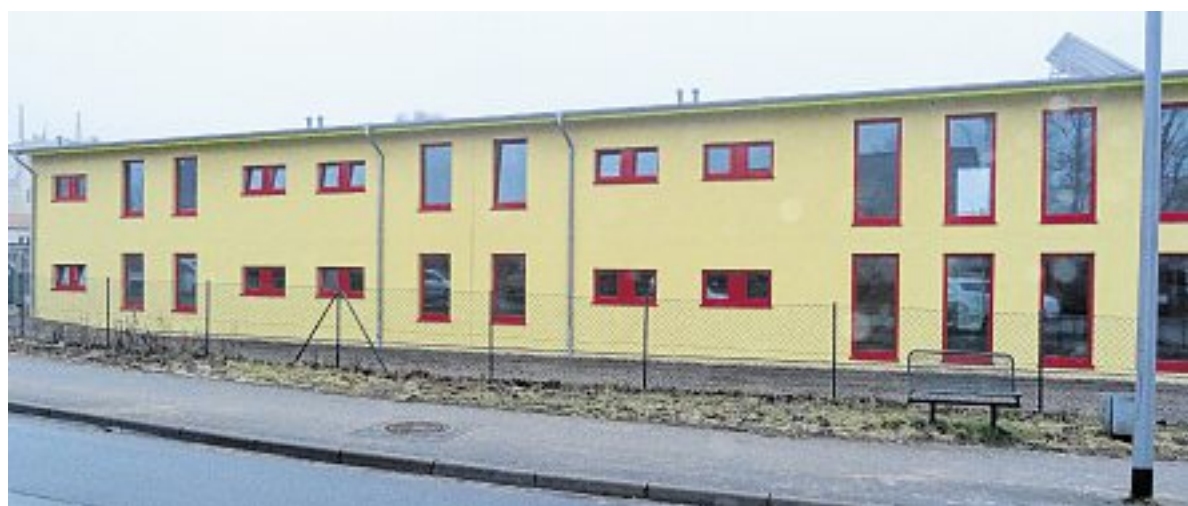
August-Seidel-Straße (Blick von der Straße)