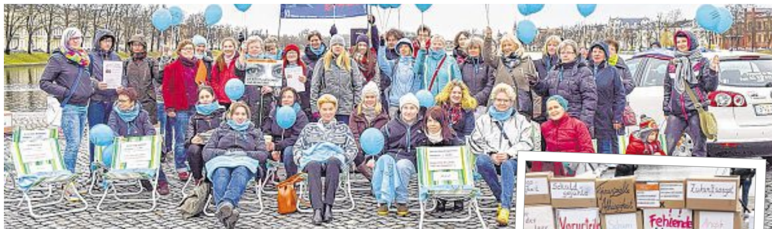
Aktion der Landesarbeitsgemeinschaft der Frauenhäuser und Beratungsstellen für Betroffene von häuslicher Gewalt Mecklenburg-Vorpommern

Am 22. Februar 2016 empfing die LAG zusammen mit Unterstützerinnen/Unterstützern und lokalen Bündnispartnerinnen/-partnern eine Aktionsgruppe des ZIF (Zentrale Informationsstelle Autonomer Frauenhäuser) am Schweriner Pfaffenteich. In einem auffällig gestalteten Reisebus fährt diese Aktionsgruppe unter dem Motto „40 Jahre Autonome Frauenhäuser in Bewegung – Gewalt gegen Frauen beenden!“